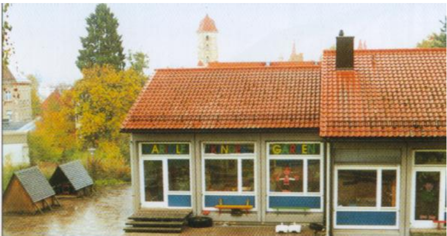
Kindergarten St. Hariolf