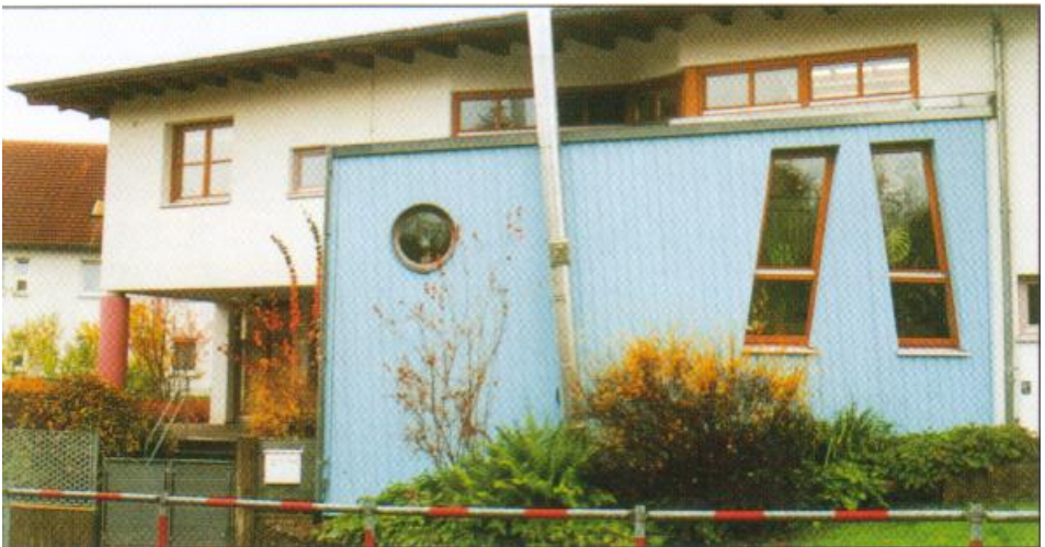
Kindergarten Heilig Geist

Wir leben mit den Kindern in der Gemeinschaft