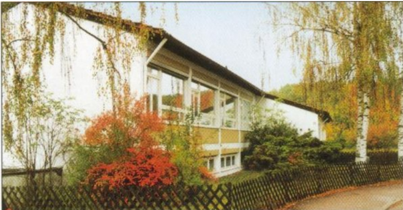
Kindergarten St. Canisius