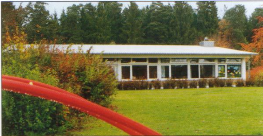
Kindergarten St. Martin