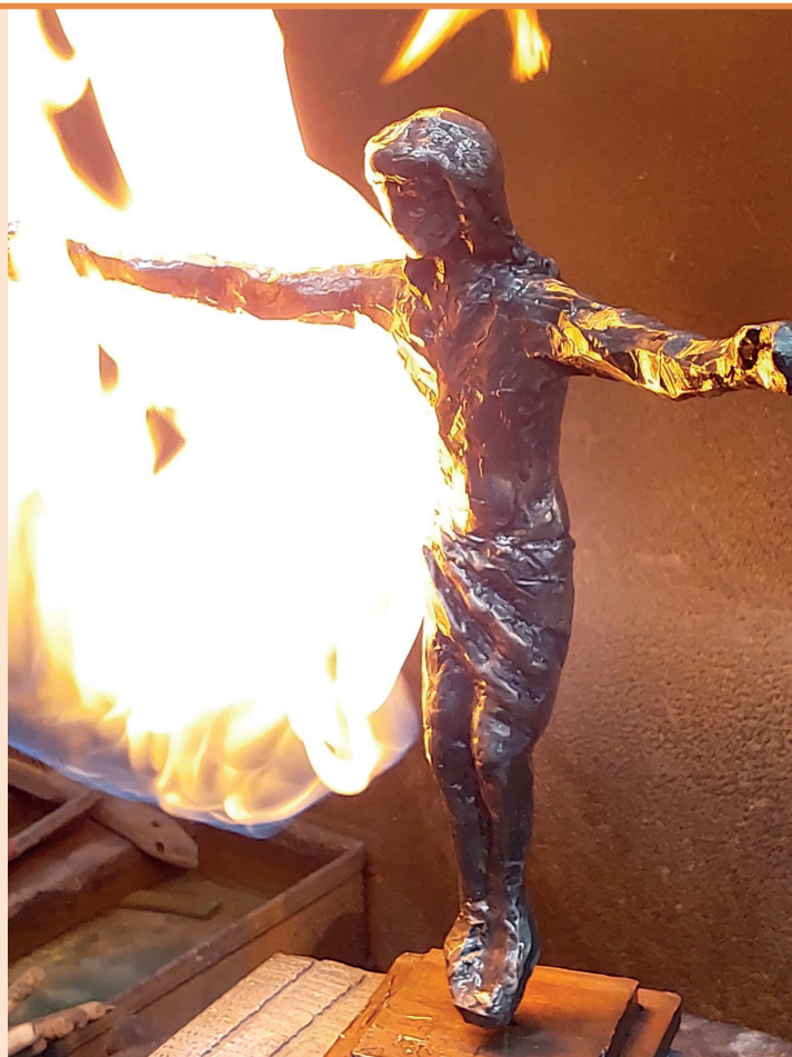
Skulptur von Ulrich Brauchle

Wir wünschen Ihnen von Herzen ein lebensfrohes und gesegnetes Osterfest.