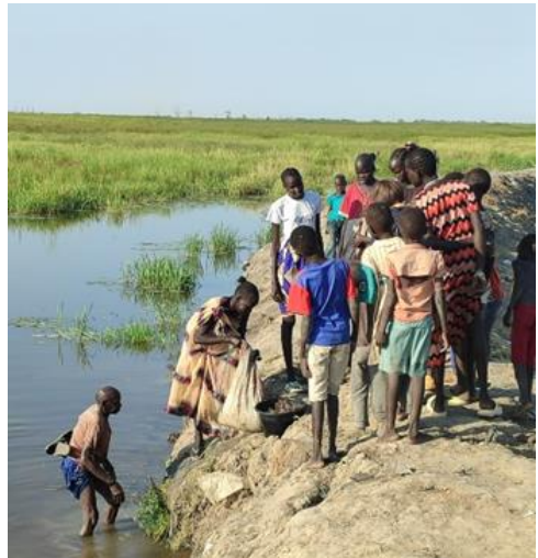
Dämme schützen vor den Fluten des Nils.

Weite Teile des Gebiets liegen in einem Überschwemmungsgebiet des Nils. Die Stadt Bentiu und die Region sind von Wasser umgeben und müssen durch Deiche und Dämme notdürftig geschützt werden. Eine Hauptnahrung sind Fische, aber andere Formen von Landwirtschaft tun sich schwer.