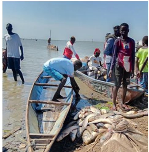
Die Menschen leben vom Fischfang