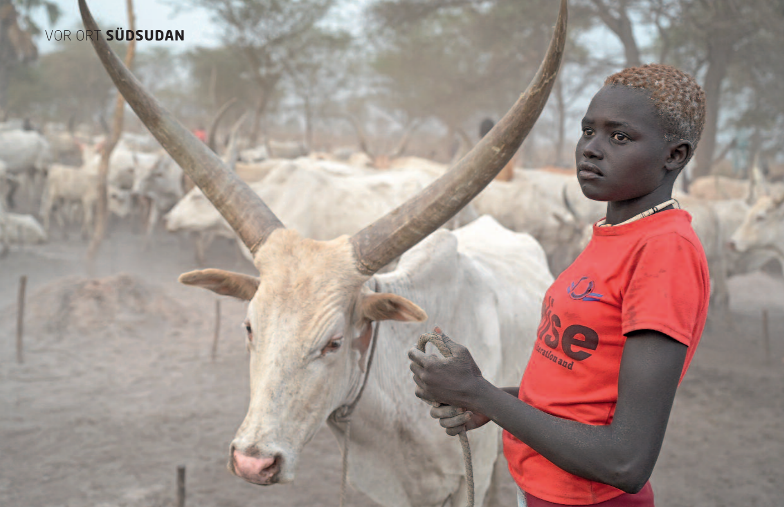
Begehrter Besitz: Wer viele Kühe hat, ist hoch angesehen. Immer wieder kommt es zu blutigen Überfällen, die viele Menschenleben fordern.