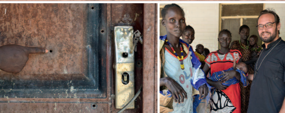
Spuren des Überfalls: Gewehrkugeln schlugen in der Tür ein. Bischof Christian hat knapp überlebt.