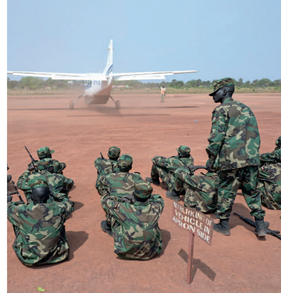
Militär überall: Bei einer Trauerfeier am Flughafen von Rumbek.