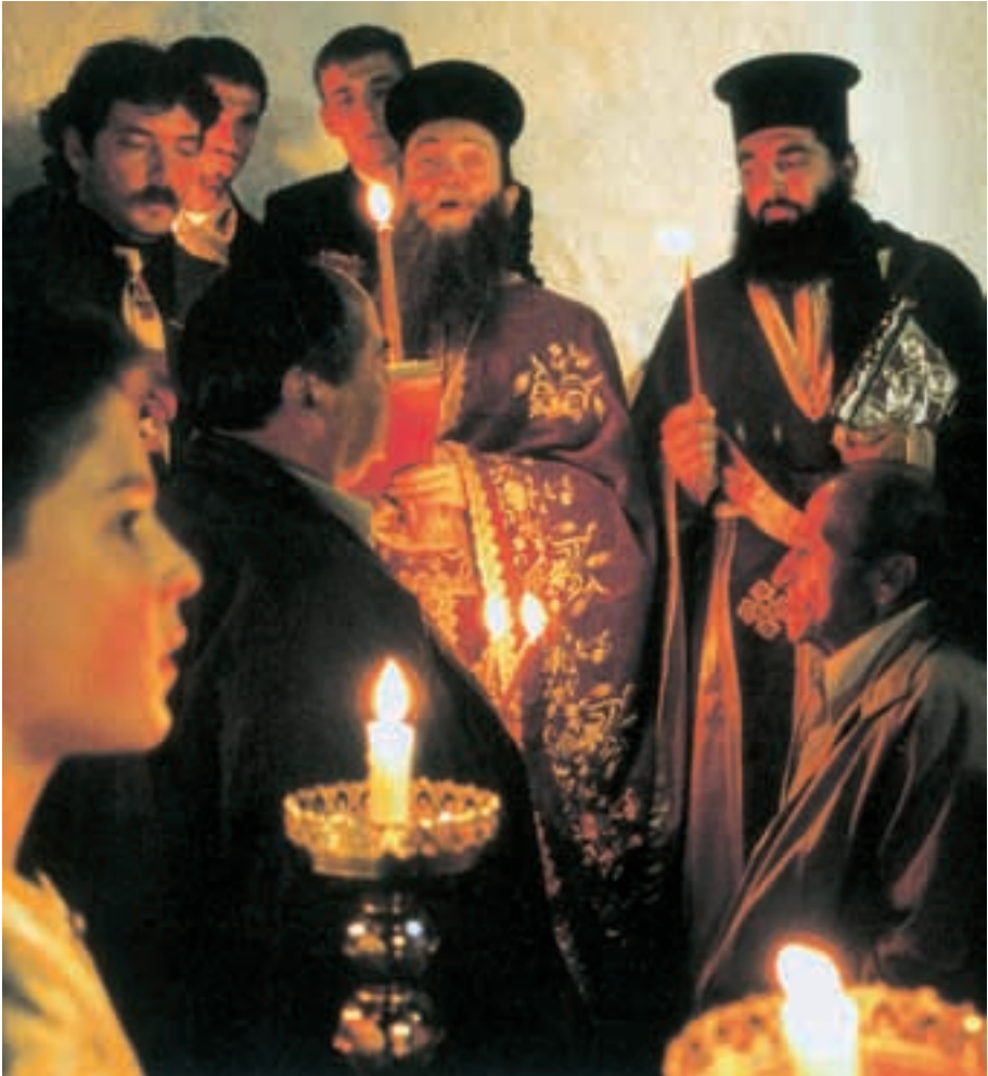
Osternacht in der slawisch-byzantinischen Liturgie.

vor Augen. Und dieser lebensrettende Gott errettet dann am Wendepunkt der Zeit Jesus aus dem Tod. So enthält dieser alttestamentliche Text der Osternacht eine österliche Lichtspur. Die Liturgie der Osternacht lädt uns also sehr eindringlich dazu ein, unser Leben von dieser hochheiligen Nacht bescheinen zu lassen.